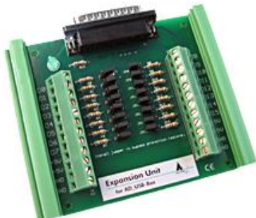
Expansion Unit für AD_USB-Box (im Lieferumfang enthalten)

Die AD_USB-Box verfügt über 8 massebezogene (single-ended) bzw. 4 differentielle analoge Eingänge sowie 4 digitale Eingänge. Weitere 16 digitale Eingänge werden über die zum Lieferumfang gehörende Expansion Unit bereitgestellt. Diese Eingänge sind zusätzlich kurzschluss- und überspannungsgeschützt.